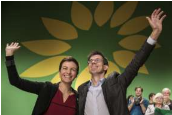
Ska Keller iz Nemačke i Bas Eickhout iz Holandije su izabrani za glavne kandidate evropske stranke Zelenih

Iako su njihove pobjede bile ograničene na zapadnoevropske zemlje, grupa koja okuplja nacionalne zelene stranke sa celog kontinenta, povećala je u celini broj mesta u Evropskom parlamentu sa 52 na 67. Oni su ostvarili gotovo šokantne rezultate u Nemačkoj, gde su drugi, u Velikoj Britaniji, gde su pobedili i laburiste i konzervativce, i u Francuskoj, gde su od praktično nepostojeće snage postali treća najveća stranka. Zeleni Irske i Finske takođe su zabeležili velike dobitke.