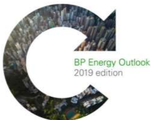
Tabela koju je IER pripremio na osnovu podataka iz Svetskog energetskeg pregleda naftne kompanije BP, BP Energy Outlook , pokazuje kretanje pojedinačnog i ukupnog udela ta tri fosilna izvora energije u 1988., 2003. i 2017. godini :

Poražavajući zaključak analize glasi da će se barem 80 odsto energije i dalje proizvoditi u narednim godinama, ako je i decenijama iz uglja, nafte i gasa.