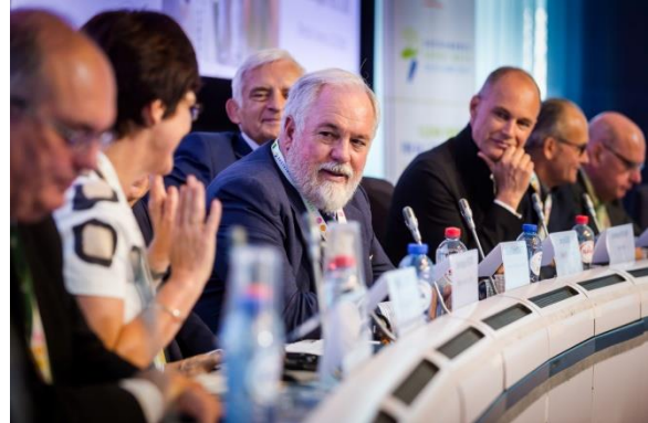
EU komesar za energiju Arijas Kanjete na sastanku sa ambasadorima EU28

Proces razmatranja zahteva i odobravanja izuzeća obično traje nekih šest meseci, za koje vreme Severni tok 2 ne bi imao dozvolu da transportuje gas.