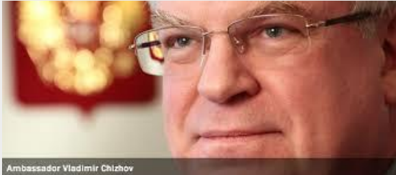
Ambasador Vladimir Chizhov

BRISSEL - Severni tok 2 će biti izgrađen uprkos promena u EU Direktivi o gasu, rekao je u prošli četvrtak ruski ambasador u EU, Vladimir Čižov.