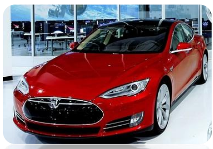
2012 Tesla S model

NJUJORK – Poznati američki proizvođač elektromobila, kalifornijska kompanija Tesla Motors, borila bi se za opstanak da ove godine nije primila stotine miliona dolara finansijske podrške federalnih vlasti, prenosi Wall Street Journal . Finansijsko stanje Tesle je toliko loše, a njena tržišna vrednost procenjena na čak četiri milijarde dolara, da je američki berzanski dnevnik stavlja na listu glavnih kandidata u Silikonskoj dolini za berzanski slom u 2013. – izuzev ako ne dobije značajno više sredstava iduće godine.