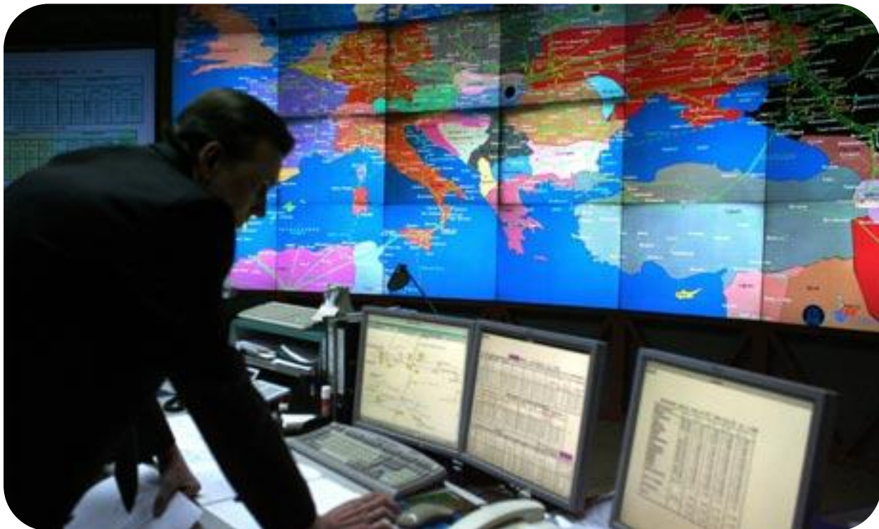
Foto: Kontrolna soba u sedištu Gazproma

MOSKVA/LONDON - Gazprom će najverovatnije smanjiti u 2013. godini evropskim kupcima cene gasa na oko 370 dolara za hiljadu kubika sa ovogodišnjih u proseku iznad 400$/1.000 m 3 , prenosi Reuters informaciju dobijenu u utorak iz jednog izvora ruske kompanije. Neimenovani izvor ovo prilagođavanje cena iz Gazpromovih dugoročnih ugovora onima na spot tržištu gasa